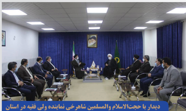
دیدار با حجت الاسلام والمسلمین شاهرخی نماینده ولی فقیه در استان