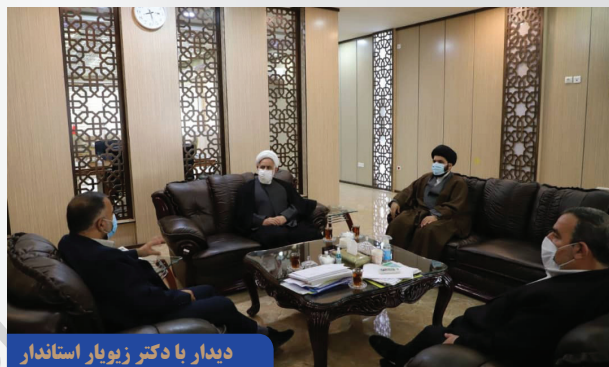
دیدار با دکتر زیویار استاندار