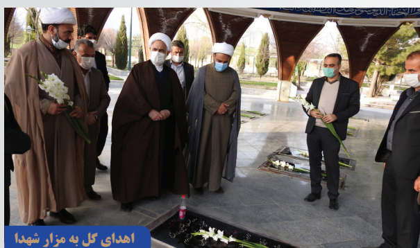
اهدای گل به مزار شهدا