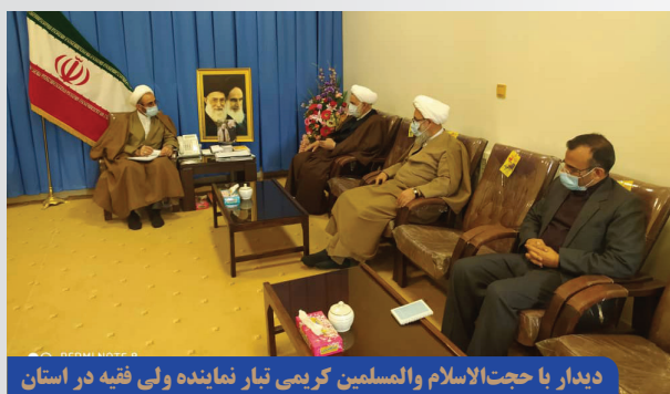
دیدار با حجت الاسلام والمسلمین کریمی تبار نماینده ولی فقیه در استان