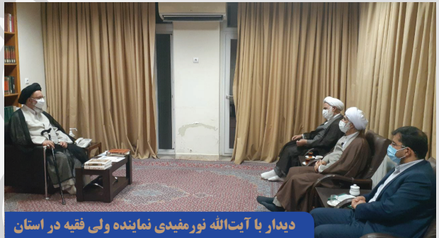
دیدار با آیت الله نورمفیدی نماینده ولی فقیه در استان