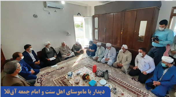
دیدار با ماموستای اهل سنت و امام جمعه آق قلا