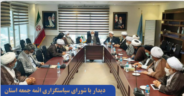
دیدار با شورای سیاست‌گذاری ائمه جمعه استان