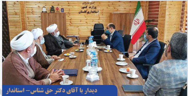
دیدار با آقای دکتر حق شناس - استاندار