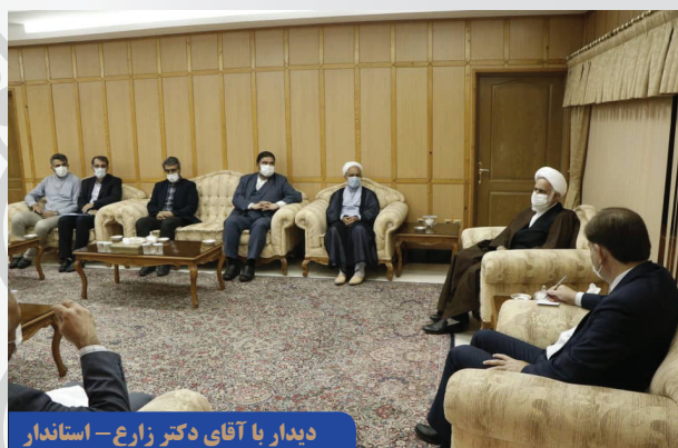
دیدار با آقای دکتر زارع - استاندار