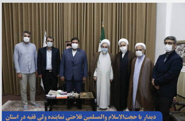
دیدار با حجت الاسلام والمسلمین فلاحی نماینده ولی فقیه در استان