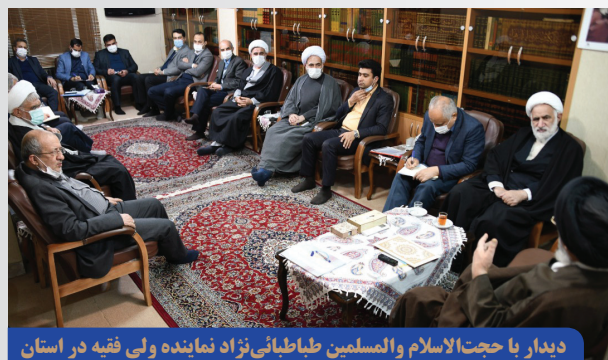
دیدار با حجت الاسلام والمسلمین طباطبائی نژاد نماینده ولی فقیه در استان