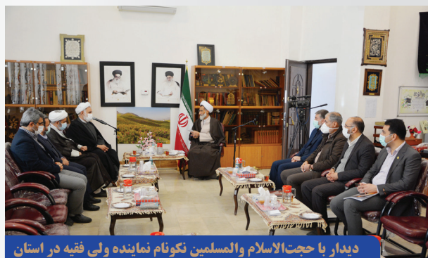
دیدار با حجت الاسلام والمسلمین نگونام نماینده ولی فقیه در استان