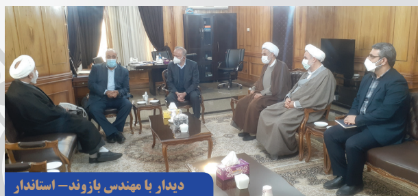
دیدار با مهندس بازوند - استاندار