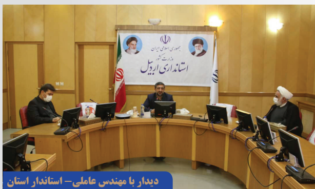
دیدار با مهندس عاملی - استاندار استان