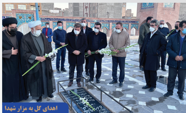
اهدای گل به مزار شهدا