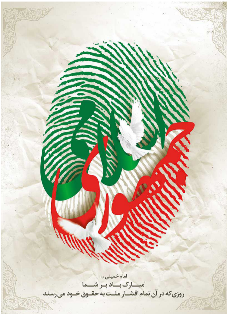
امام خمینی (ره) مبارک باد بر شما روزی که در آن تمام اقشار ملت به حقوق خود می رسند.

بیانات در دیدار فرماندهان و کارکنان نیروی هوایی ارتش ۱۳۹۲/۱۱/۱۹